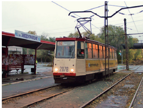
Челябинский металлургический комбинат, трамвайная остановка «Заводоуправление»

В городе работает 16 трамвайных и 17 троллейбусных маршрутов. Интересно, что стоимость проезда различается в летний и зимний периоды. Поддерживаются очень высокие скорости движения трамвая: на длинных перегонах до 60 км/ч. Электротранспорт подвозит пассажиров к проходным нескольких заводов, а на территории Челябинского металлургического комбината даже проходит трамвайная линия, проехать по которой могут только работники завода.