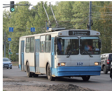
Ярославль, троллейбус ЗиУ-682 с изменённой лобовой частью

счёт использования элементов автобусов МАЗ при ремонте лобовой части.