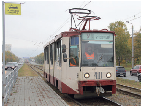
Челябинск, учебный вагон 71-608К с двумя токоприёмниками

ски: бежевый верх и коричневый фальшборт. Это оформление показало мне неудачным. Кроме того, как пассажира меня раздражало обилие самой разной информации, непрерывно транслируемой водителями по громкой связи.