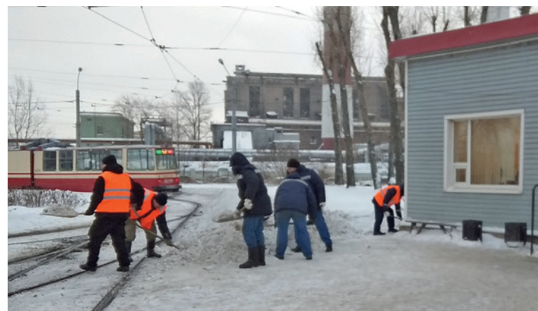
Снежный субботник на конечной станции «Северная верфь»

Коллеги путейцев из других подразделений не оставили их один на один со стихией. Вооружившись де-