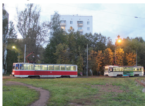
Ярославль, вагоны 71-605 и 71-619 на к/ст «Улица Чкалова»

Местное предприятие электрического транспорта является акционерным обществом. Трамвайная сеть в лучшие годы была достаточно разветвлённой, однако сильно пострадала в годы кризиса электротранспорта России в начале 2000-х годов. К большому сожалению, сейчас трамвай даже не доходит до железнодорожного вокзала и исторического центра. В основном эксплуатируются вагоны 71-619. Постепенно выходят на линию 20 трамваев этой же модели, переданные Ярославлю Москвой.